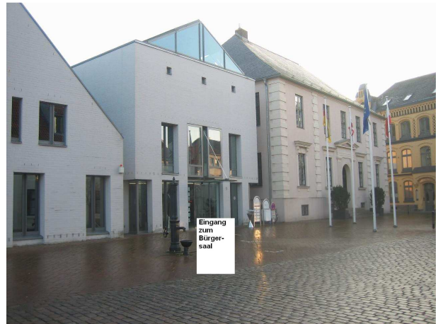
zum Bürgersaal im Rathaus

Hier Parken - im oberen Bereich ( die unteren sind Behinderten-P) meist alles frei.. es ist ja Winter.