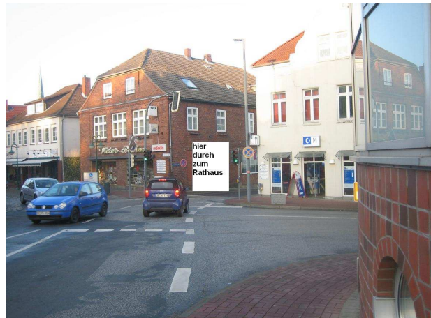
hier durch gehts zum Rathaus

in die Straße "am kleinen See" kurvenreich der Straße folgen, wenn dann das Rathaus rechts auftaucht ( und links die Bürgerstuben), nach links in " Winklers Gang" zum Parkplatz abbiegen.