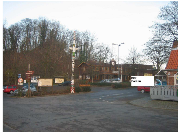
Parken am Kalkbergstadion

Das Rathaus ist dann schon zu sehen.. um das Gebäude herum.. zum Eingang