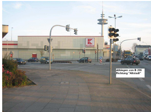
hier ab in die